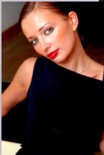
Дочь Оксана Никифорова - трехкратная чемпионка мира,